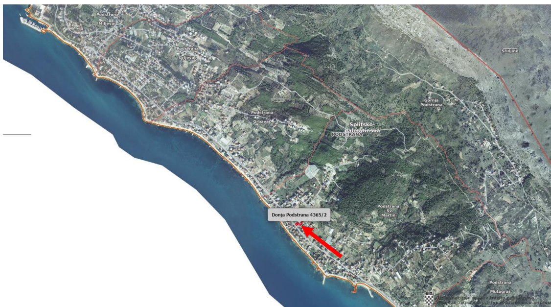
Slika 1: ŠIRE PODRUČJE

Predmet ove procjene je poslovni prostor u prizemlju, uključujući i pripadajuće dijelove, lođa i parkirališni prostor, koji se nalaze na adresi Sveti Martin 89, Donja Podstrana. Stambena se zgrada nalazi na kat.čest.zem 4365/2, ZK uložak 3619 K.O. Donja Podstrana. Mikrolokaciju čine objekti iste ili slične namjene.