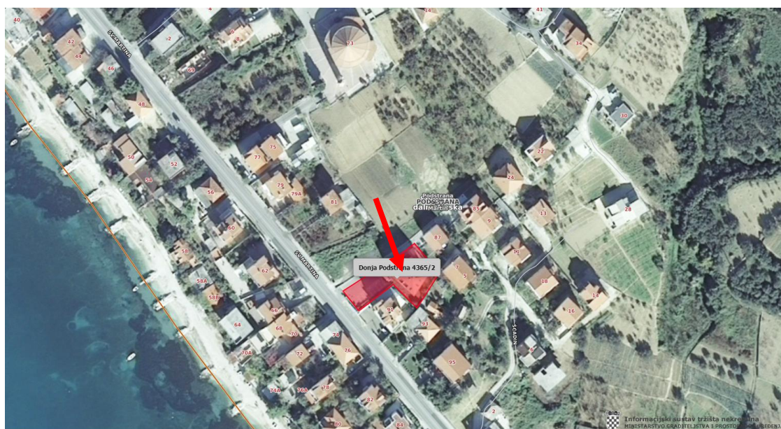
Slika 2: UŽE PODRUČJE (preuzeto sa www.nekretnine.mgipu.hr )